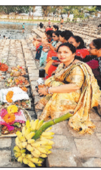
सावित्री नगर कालोनी तमनार में की गई चैती छठ पर सूर्य देव की आराधना

रायगढ़। चैत माह के छठ से प्रारंभ हुए चैती छठ का समापन बुधवार की सुबह उगते हुए भगवान भुवन भास्कर को अर्घ्य देकर किया गया। सावित्री नगर कालोनी तमनार में भी चैती छठ की पूजा के लिए विशेष व्यवस्था की गई थी। जहां ब्रतियों ने जल में खड़े होकर उगते सूर्य को अर्घ्य दिया। छठ पूजा साल में दो बार की जाती है एवं पूजा पूर्वांचल के लोगों के लिए विशेष होती है। इस दिन का इंतजार लोगों को बेसब्री से रहता है। इस बार चैती छठ की शुरुआत रविवार को नहाए खाए के साथ हुई। शाम से ब्रती महिलाओं ने उपवास प्रारंभ किया। मंगलवार की शाम को ब्रति महिलाएं पूजा का सामान सूर्य में सजाकर तालाब पहुंचीं। यहां पर डूबते सूर्य को अर्घ्य दिया गया। इस पूजा में साफ सफाई स्वच्छता का विशेष ध्यान रखा जाता है। चैती छठ के अंतिम दिन बुधवार को उगते सूर्य को अर्घ्य देने के लिए बड़ी संख्या में महिलाएं व उनके परिजन तालाब पहुंचे। यहां उगते हुए सूर्य को अर्घ्य देकर व्रत की पूर्णता की गई। इसके बाद लोगों ने पारणा किया।