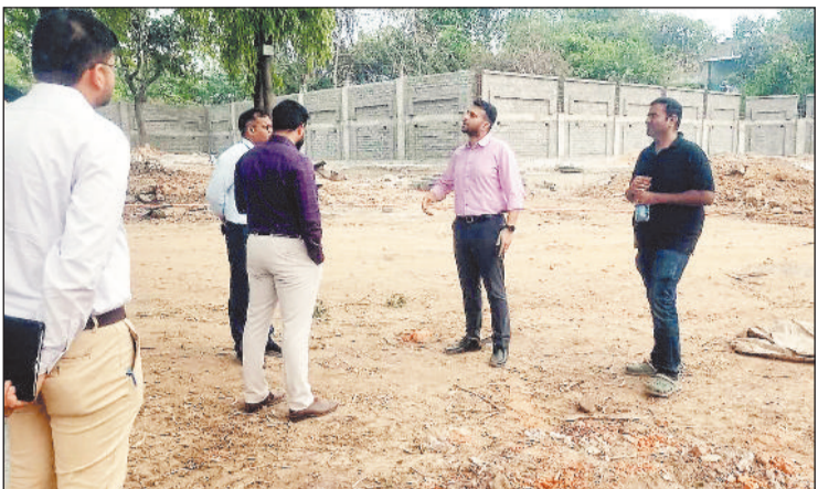
जायजा लेने पहुंचे कलेक्टर।

परियोजनाओं को निर्धारित समय से पहले पूर्ण करना जिला प्रशासन की प्राथमिकता है। कलेक्टर ने सबसे पहले नालंदा परिसर के निर्माण कार्य का जायजा लिया। वर्तमान में इस परियोजना का 60 प्रतिशत कार्य पूरा हो चुका है। उन्होंने आगामी जून से पहले इस परिसर का लोकार्पण सुनिश्चित करने का निर्देश दिया ताकि छात्र