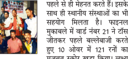
और उपविजेता टीमों को पुरस्कार प्रदान किए गए। रायगढ़ नगर निगम क्षेत्र में बीते 4 वर्ष से लगातार स्थानीय पंजर प्लांट युवा संघ द्वारा शहीद कर्नल विप्लव त्रिपाठी वार्ड विजेता कप टेनिस बॉल क्रिकेट प्रतियोगिता का आयोजन शहीद कर्नल विप्लव त्रिपाठी मिनी स्टेडियम में किया जाता रहा है। जिस आयोजन को सफल बनाने के लिए समिति के सभी युवा 1 महीने

रायगढ़। नगर निगम क्षेत्र का प्रसिद्ध आयोजन शहीद कर्नल विप्लव त्रिपाठी वार्ड विजेता कप टेनिस बॉल क्रिकेट प्रतियोगिता का समापन मंगलवार को पुरस्कार वितरण समारोह के साथ हुआ। इस प्रतिष्ठित आयोजन में वार्ड नंबर 21 ने शानदार प्रदर्शन करते हुए खिताब अपने नाम किया, जबकि वार्ड नंबर 28 उपविजेता रही।