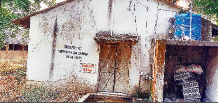
हरिभूमि न्यूज ►► रायगढ़

बिलासपुर में बर्ड फ्लू सामने आने के बाद रायगढ़ में अलर्ट कर दिया गया है। बिलासपुर से खरीदी-बिक्री और परिवहन पर पाबंदी लगा दी गई है। साथ ही बार्डर में भी निगरानी रखी जा रही है। शौकिनों को एहतियात बरतने की हिदायत दी जा रही है। शहर और आसपास संचालित मुर्गा कटिंग, अंडा दुकान के साथ पोल्ट्री फार्म पर विशेष निगरानी रखी जा रही है। पशु