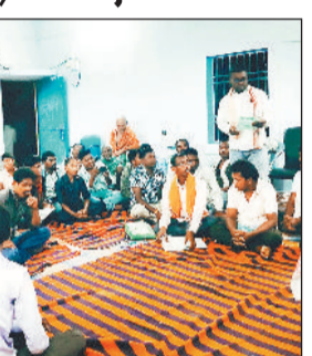
दशकर्म में भी राशि और विवाह करने के पहले पंचगण की उपस्थिति देना व नवजात शिशु बच्चे की संस्कार के लिए छठी 21 दिन के अंदर करना आवश्यकता है।

जुड़ा/लोईग। रायगढ़ पूर्वांचल के ग्राम पंचायत जुड़ा के लोहार विश्वकर्मा समाज द्वारा गजमगर पहाड़ वनस्थली काबाग पाठ के पश्चिम तट पर बसे ग्राम जुड़ा में समाज का वार्षिक बैठक किया गया।